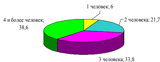
Рис. 3. Соотношение респондентов в зависимости от состава семьи, %

Средний состав семьи респондентов – 3 и более человек (рис. 3).