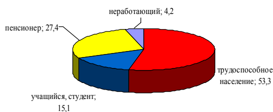
Рис. 2. Соотношение респондентов в зависимости от рода занятий, %

По роду занятий основная доля опрошенных – трудоспособное население и пенсионеры (рис. 2).