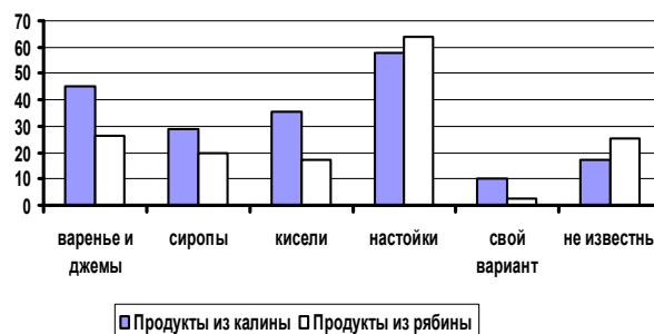
Рис. 4. Популярность продуктов на основе калины и рябины

сы. Большинство респондентов (около 90 % по каждому из упомянутых видов продуктов) не совершают покупки. Остальные опрошенные совершают покупки один раз в несколько месяцев и лишь некоторые – раз в месяц и раз в неделю