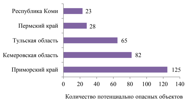
Рисунок 3. Регионы РФ с наибольшим количеством потенциально опасных субъектов

Человечество изобрело множество способов борьбы с загрязнением почвы. Одним из самых