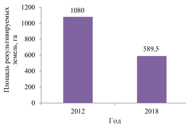
Рисунок 2. Площадь рекультивируемых земель